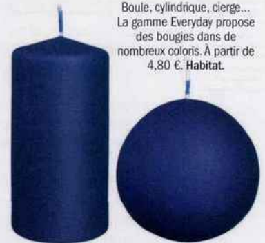
Boule, cylindrique, cierge... La gamme Everyday propose des bougies dans de nombreux coloris. À partir de 4,80 €. Habitat.