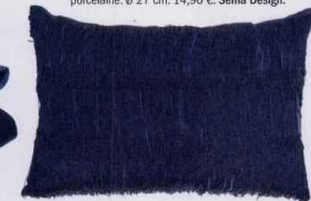
Look glamour et raffiné pour ce coussin paré de précieuses franges. L. 60 x l. 40 cm. 47 €. Bloomingville. Made in Design.