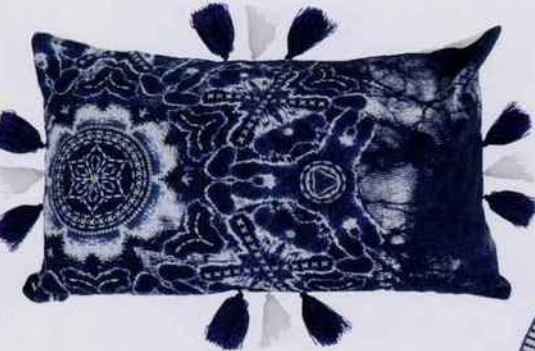
Un festival de pompons et de palmettes étourdissantes sur cette housse de coussin. L. 40 x l. 40 cm. 55,20 €. Madura.