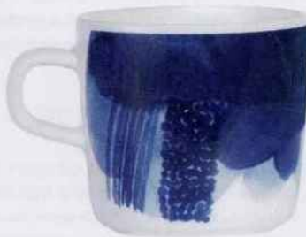
Cette tasse à café en porcelaine associe différentes teintes de bleu nuit pour un effet orageux. 18,50 €. Marimekko. Blou Paris.