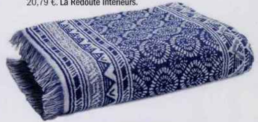
Drap de bain en éponge jacquard 100 % coton, finition frangée. L. 140 x l. 70 cm. 20,79 €. La Redoute Interieurs.