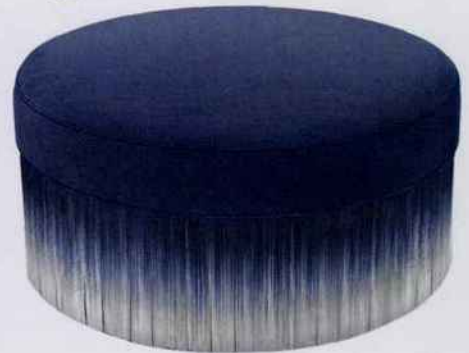
Vêtu de velours et de franges teintées en dégradé, ce pouf apporte une touche rétro de style années 30'. H. 40 x Ø 80 cm. 1 765 €. Moooi. Made in Design.