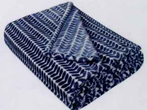
Ce superbe plaid arbore un imprimé végétal qui lui donne une touche très raffinée. L. 170 x l. 130 cm. 12,99 €. Alinéa.