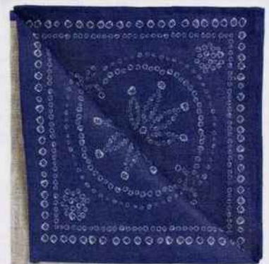
Serviettes de table en lin imprimé. 22,99 € le lot de 4. Zara Home.