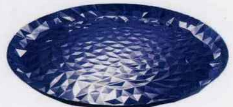
Les reflets irisés bleus du métal donnent un caractère précieux à ce plateau. En acier coloré à la résine époxy. Ø 40 cm, 103 €. Alessi.