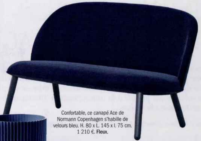
Confortable, ce canapé Ace de Normann Copenhagen s'habille de velours bleu. H. 80 x L. 145 x l. 75 cm. 1 210 €. Flexu.