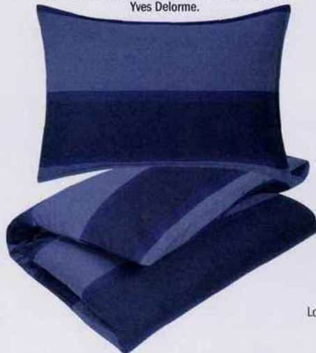
Parure de lit en satin imprimé. Housse de couette L. 240 x l. 220 et 2 taies L. 75 x l. 50 cm. 375 €. Yves Delorme.