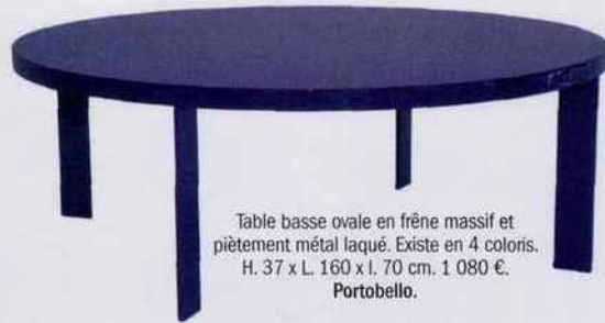
Table basse ovale en frêne massif et piètement métal laqué. Existe en 4 coloris. H. 37 x L. 160 x l. 70 cm. 1 080 €. Portobello.