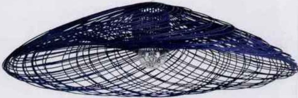
Cette suspension imaginée par Élise Fouin offre un design poétique. Ø 110 cm. 450 €. Forestier. Light on Line.