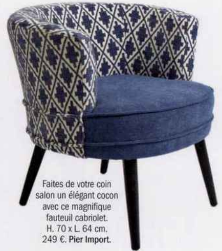
Faites de votre coin salon un élégant cocon avec ce magnifique fauteuil cabriolet. H. 70 x L. 64 cm, 249 €. Pier Import.