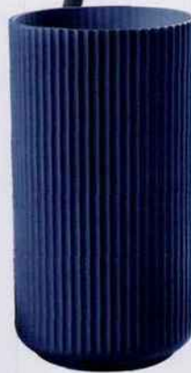
Ce vase en porcelaine de chez Lyngby Porcelain est d'une élégante simplicité avec ses motifs striés. H. 20 x Ø 10,5 cm. 96 €. Royal Design.